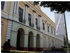
Emitirá UAEM segunda convocatoria