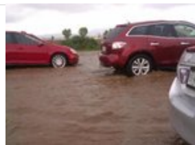
Se inunda la Toluca-Tenango